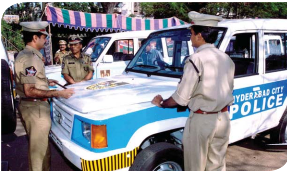
రక్షక్ వాహనాలతో పోలీసు ఉన్నతాధికారులు