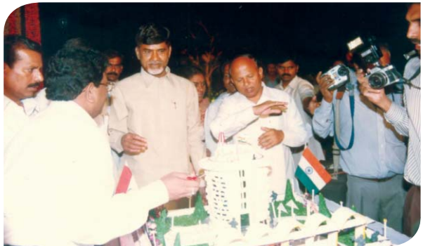
హైటెక్ సిటీ నమూనాను పరిశీలిస్తున్న సీఎం శ్రీ చంద్రబాబు నాయుడు, హోంమంత్రి శ్రీ టి.దేవేందర్ గౌడ్