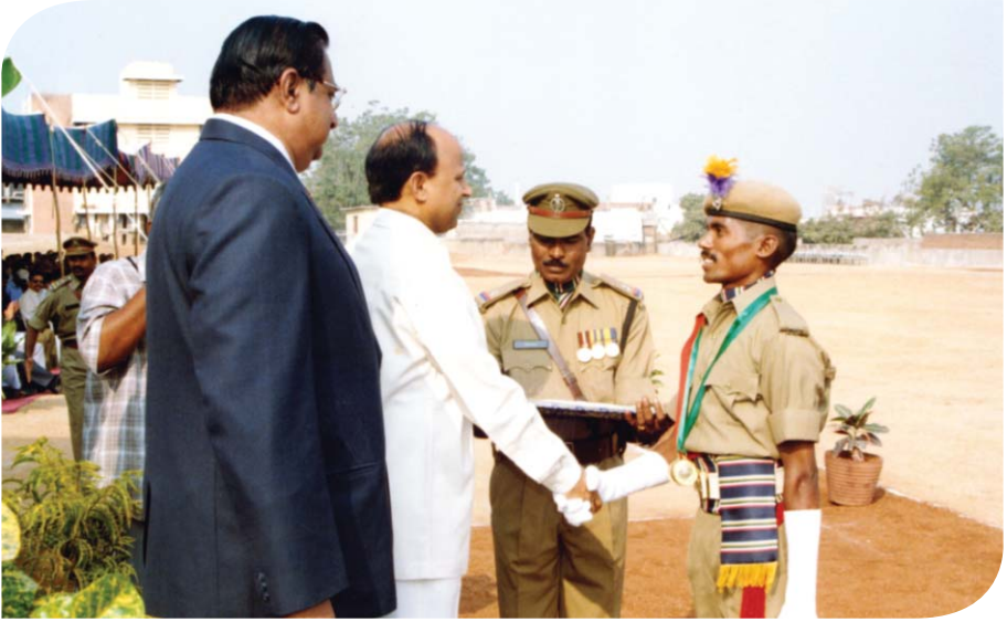
విధినిర్వహణలో అత్యున్నత ప్రమాణాలు చూపిన పోలీసులకు రిపబ్లిక్ డే సందర్భంగా పురస్కారాలు అందిస్తున్న హోంమంత్రి శ్రీ టి.దేవేందర్ గౌడ్