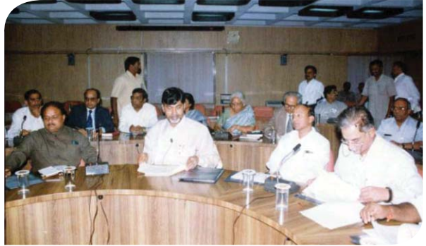
వీడియో కాన్ఫరెన్స్లో సిఎం చంద్రబాబుతో హోంమంత్రి శ్రీ టి.దేవేందర్ గౌడ్, మంత్రులు శ్రీ అశోక్ గజపతిరాజు, శ్రీ యనమల రామకృష్ణుడు