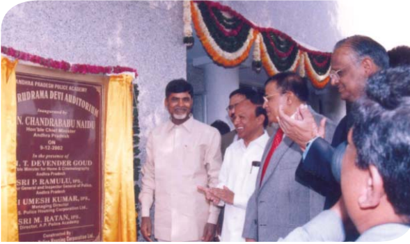
నేషనల్ పోలీస్ అకాడమీ (అప్పా) ఆవరణలో కొత్తగా నిర్మాణమైన ఆడిటోరియం ప్రారంభోత్సవ కార్యక్రమంలో ముఖ్యమంత్రి శ్రీ ఎన్. చంద్రబాబు నాయుడుతో హోంశాఖామాత్యులు శ్రీ టి.దేవేందర్ గౌడ్