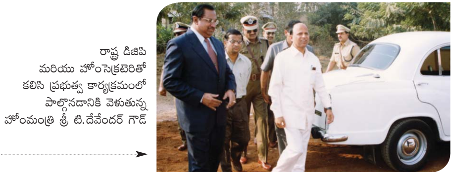
రాష్ట్ర డిజిపి మరియు హోంసెక్రటెరితో కలిసి ప్రభుత్వ కార్యక్రమంలో పాల్గొనడానికి వెళుతున్న హోంమంత్రి శ్రీ టి.దేవేందర్ గాడ్