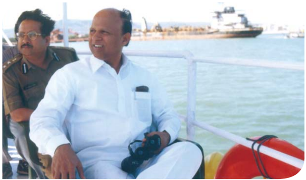
పోలీసు ఉన్నతాధికారులతో కలిసి వైజాగ్ తీర ప్రాంతం పరిశీలన చేస్తున్న హోంమంత్రి శ్రీ టి.దేవేందర్ గౌడ్