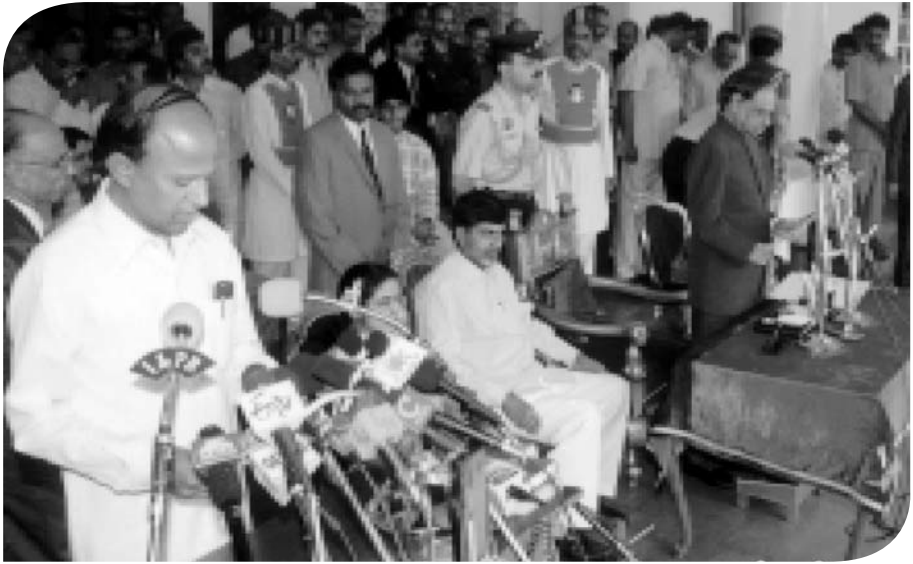
రాష్ట్ర హోంమంత్రిగా శ్రీ టి.దేవేందర్ గౌడ్తో ప్రమాణ స్వీకారం చేయిస్తున్న గవర్నర్ శ్రీ సి.రంగరాజన్