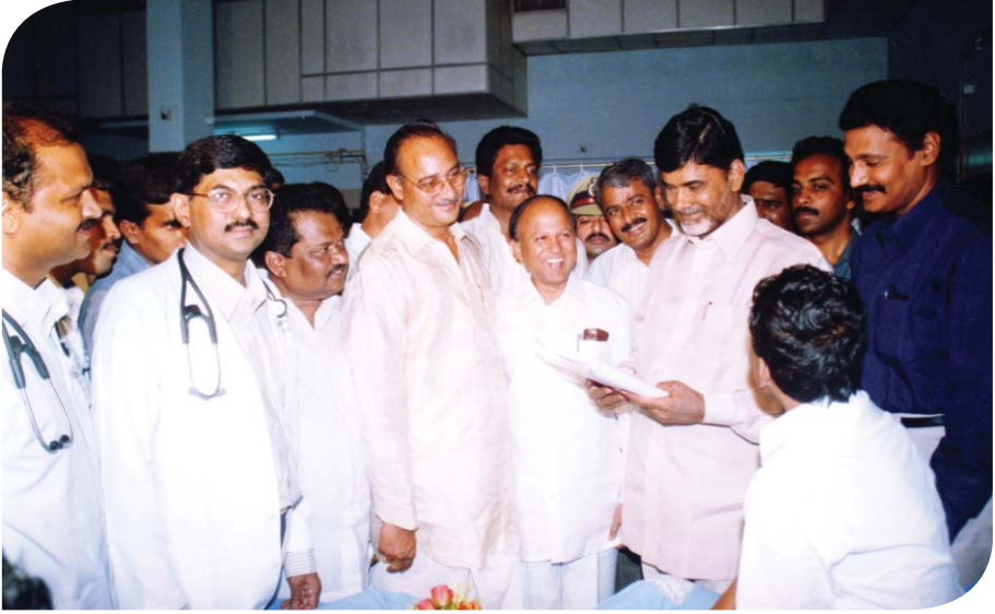
ఆసుపత్రిలో సిఎం చంద్రబాబు, సహచర మంత్రులు, నాయకులతో హోంశాఖామాత్యులు శ్రీ టి.దేవేందర్ గౌడ్