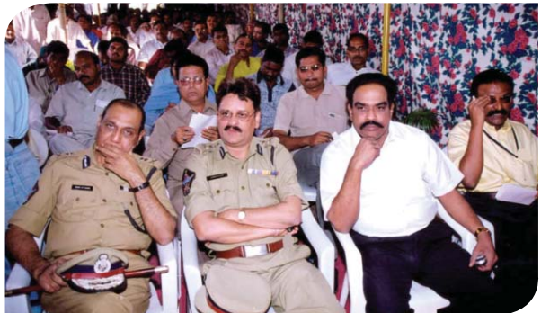
కార్యక్రమంలో పాల్గొన్న పోలీసు ఉన్నతాధికారులు, సిబ్బంది