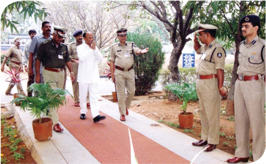
రాష్ట్ర హోంమంత్రి శ్రీ టి.దేవేందర్ గౌడ్కు సాదర ఆహ్వానం పలుకుతున్న పోలీసు అధికారులు, డిజిపి శ్రీ హెచ్.జె.దొర, ఇతర ఉన్నతాధికారులు