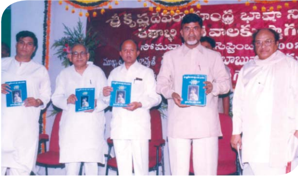
సాహితీవేత్త సినారే, సిఎం చంద్రబాబుతో కలిసి పుస్తక ఆవిష్కరణ సభలో పాల్గొన్న హోంమంత్రి శ్రీ టి.దేవేందర్ గౌడ్