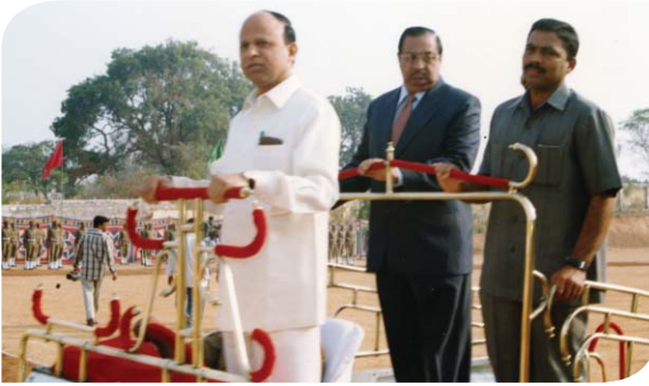
పోలీసు వందన స్వీకరణ