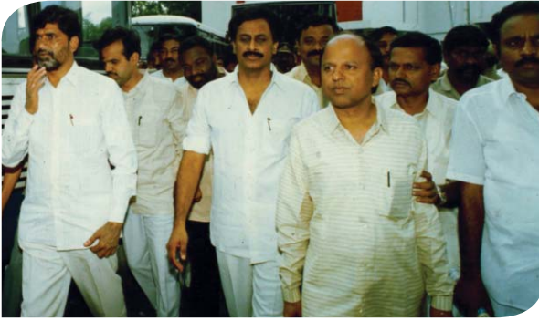
శ్రీ చంద్రబాబునాయుడు, శ్రీ దగ్గుబాటి వెంకటేశ్వరరావుతో, తదితరులతో హోంమంత్రి శ్రీ టి.దేవేందర్ గౌడ్