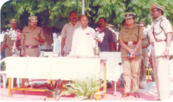
ప్రభుత్వ కార్యక్రమంలో పోలీసు ఉన్నతాధికారులతో హోంమంత్రి శ్రీ టి.దేవేందర్ గౌడ్