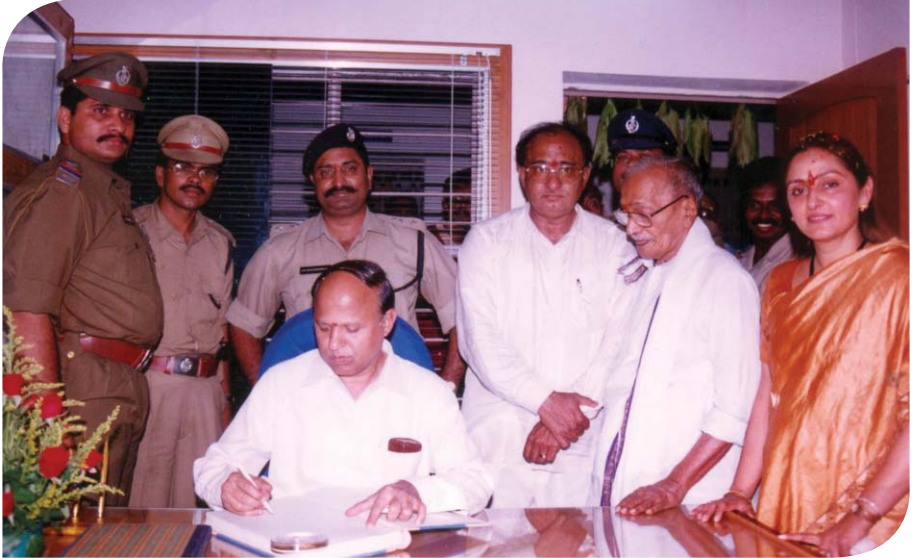
పోలీసు స్టేషన్ ప్రారంభోత్సవ సందర్భంగా శ్రీ బుచ్చయ్య చౌదరి, శ్రీమతి జయప్రదలతో హోంమంత్రి శ్రీ టి.దేవేందర్ గౌడ్